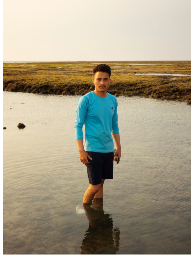
「IQ3 100MP-0368410」 (The Shel of Human) | H1,334 x W1,000 mm | Archival Pigment Print | 2024

ポートレートを意識的に撮影し始めた2010年頃から10年ほどの間は、個人を取り巻く環境や状況も、その人格と深く関わるものであるということから、様々な環境や状況、関係性のなかで人がどのように存在するのかということを考えていた。元々は存在自体への関心の上で、撮影された環境と撮影者である私自身のアイデンティティに沖縄という土地が深く関わっているという点において、okinawan portraitsであった。